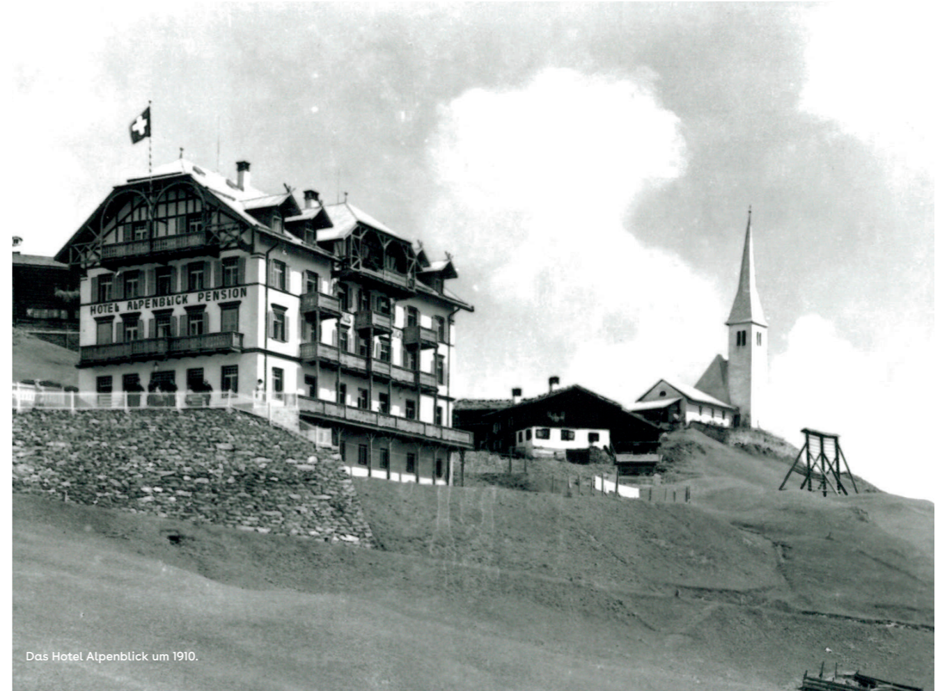
Das Hotel Alpenblick um 1910.

Mit dem Aufkommen des Wintersports, hatte das auf den Sommerbetrieb ausgerichtete Hotel einen immer schwereren Stand. Schliesslich wurde das Haus in den 1950er Jahren an die Schulgemeinde Uzwil verkauft. Diese nutzte das Haus über 60 Jahre als Schul- und Ferienlager. Daneben wurde der Hotel- und Gastwirtschaftsbetrieb fortgeführt. Diese unterschiedlichen Nutzungen und Ansprüche unter einem Dach, wurden immer schwieriger miteinander kombinierbar und neue Lösungen waren gefragt.