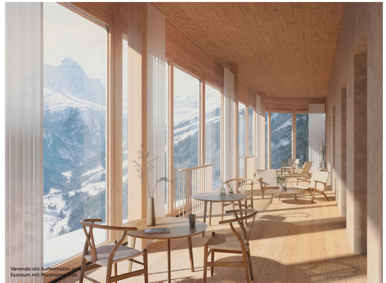
Veranda als Aufenthalts- und Essraum mit Panoramablick