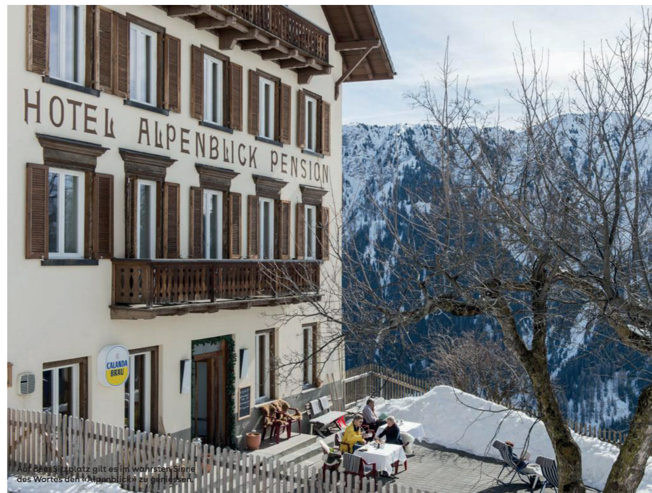
Auf dem Sitzplatz gilt es im wahrsten Sinne des Wortes den «Alpenblick» zu geniessen.