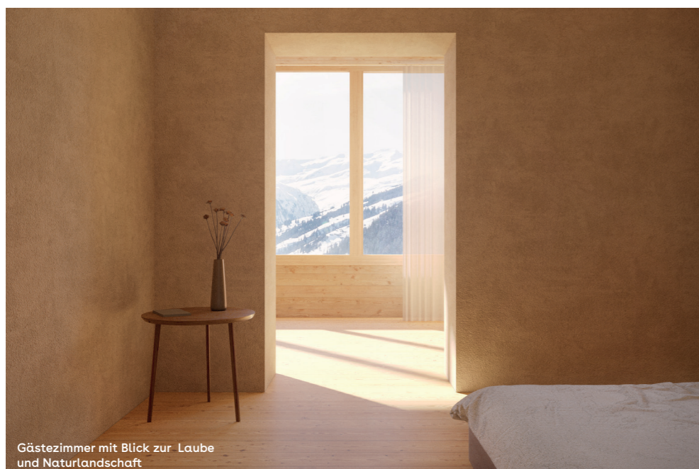
Gästezimmer mit Blick zur Laube und Naturlandschaft

«Der Alpenblick im Alpenblick ist einmalig. Die Idee die Landschaft mit dem Haus zu verschmelzen finde ich faszinierend. Diese Perle im Safiental muss neues Leben erhalten.»