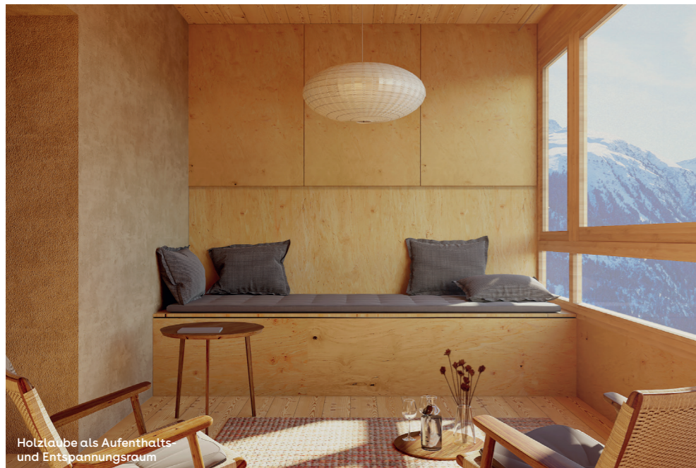
Holzlaube als Aufenthalts- und Entspannungsraum