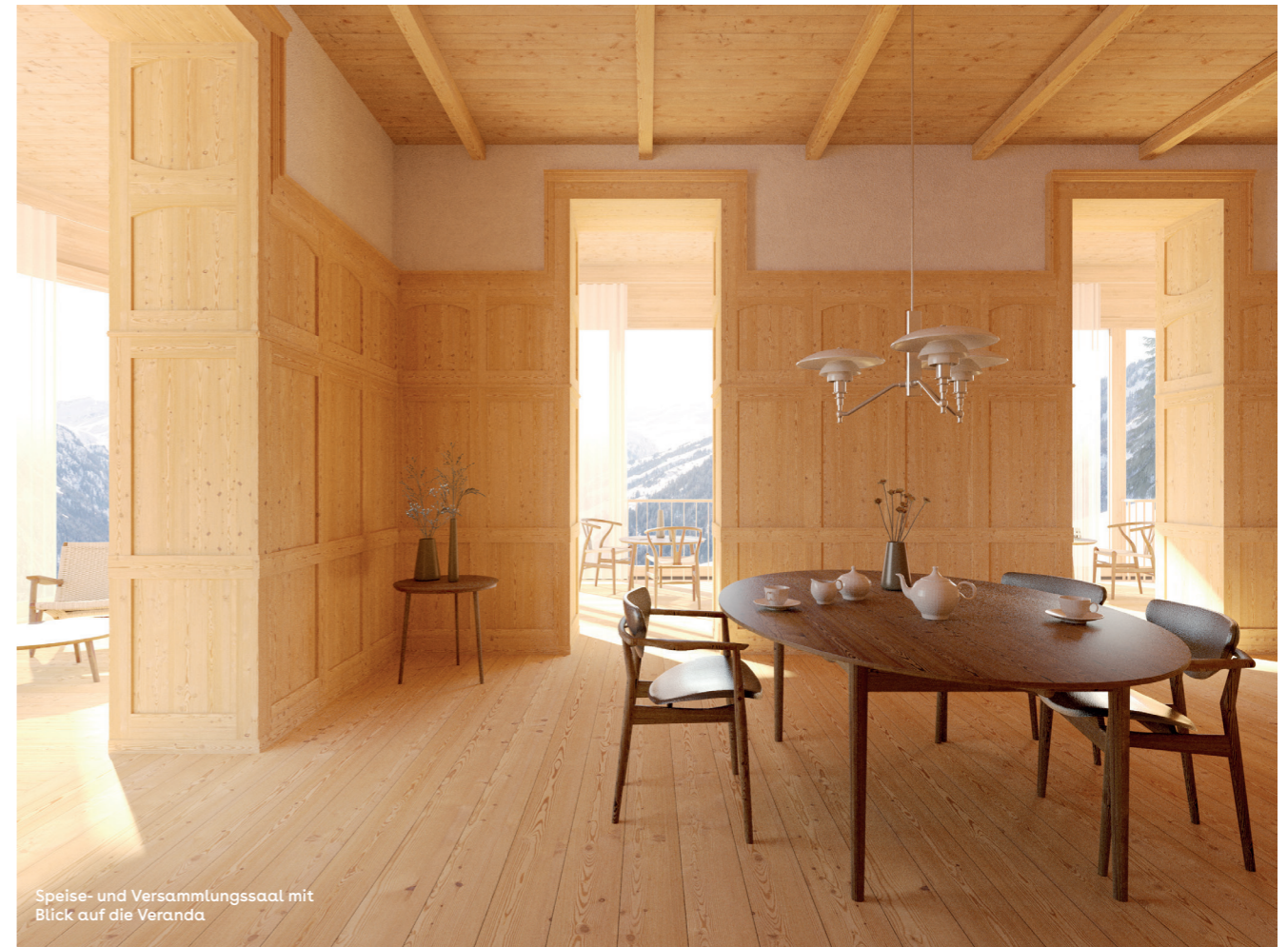
Speise- und Versammlungssaal mit Blick auf die Veranda

Verein Tenna Plus Berghotel Alpenblick im Oktober 2019