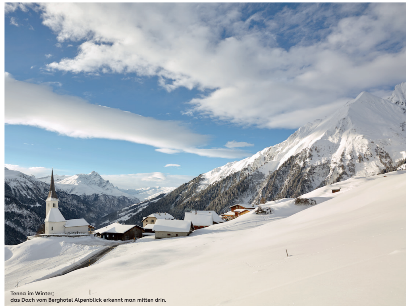
Tenna im Winter; das Dach vom Berghotel Alpenblick erkennt man mitten drin.

Der Alpenblick ist in die Jahre gekommen und die Infrastruktur entspricht nicht mehr den heutigen Standards. Energetische und sanitäre Sanierungs- und Modernisierungsmassnahmen, z.B. weg von fossilen hin zu erneuerbaren Energien, sind notwendig. Auch die Kücheneinrichtung muss neuen hygienischen Normen angepasst werden. Den Gästen soll eine zeitgemässe und komfortable Infrastruktur, ein attraktives Hotel- und nachhaltiges Gastronomieerlebnis geboten werden, damit der Betrieb erfolgreich und langfristig weitergeführt werden kann.