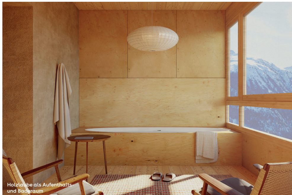
Holzlaube als Aufenthalts- und Baderaum